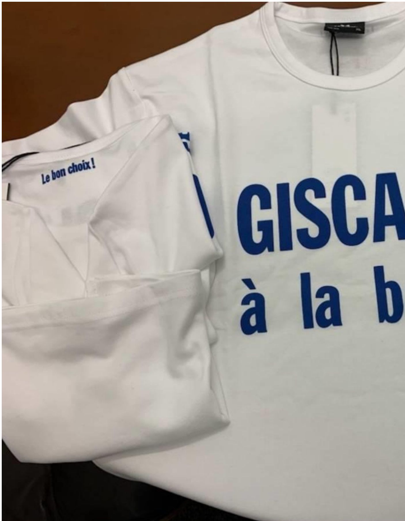
Le tee-shirt "Giscard à la barre" sera présenté à Chamalières à l'occasion